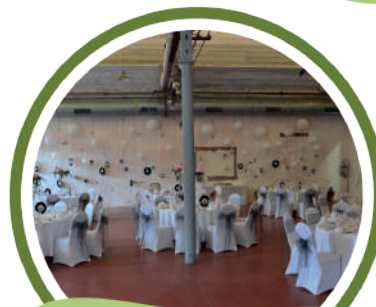
Le Théâtre de poche